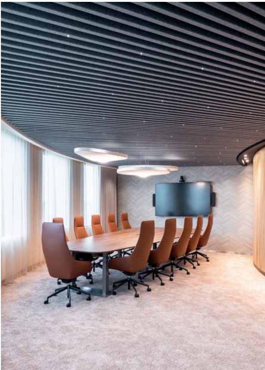
FOTO ONDER Een van de AFAS-boardrooms. Door subtiel variaties in kleurgebruik, meubels en materialen kreeg iedere kantoorverdieping een andere sfeer.

gebruikten wij zachte materialen, warme kleuren en vloeiende lijnen. De twee 'steunpilaren' gaven we extra accent door ze met hout te bekleden. Iedere afdeling heeft zijn eigen 'huiskamer' met speeltafels om te ontspannen. Door subtiel variaties in kleurgebruik, type speeltafels en de meubels gaven we iedere verdieping een andere sfeer."