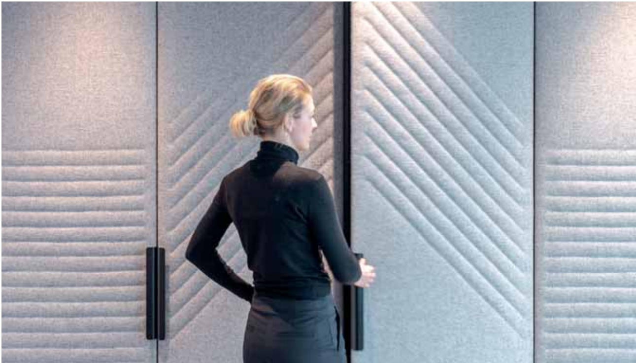
FOTO BOVEN Garderobekasten zijn weggewerkt in een op maat gemaakte wand die subtiel bekleed is met akoestisch materiaal.